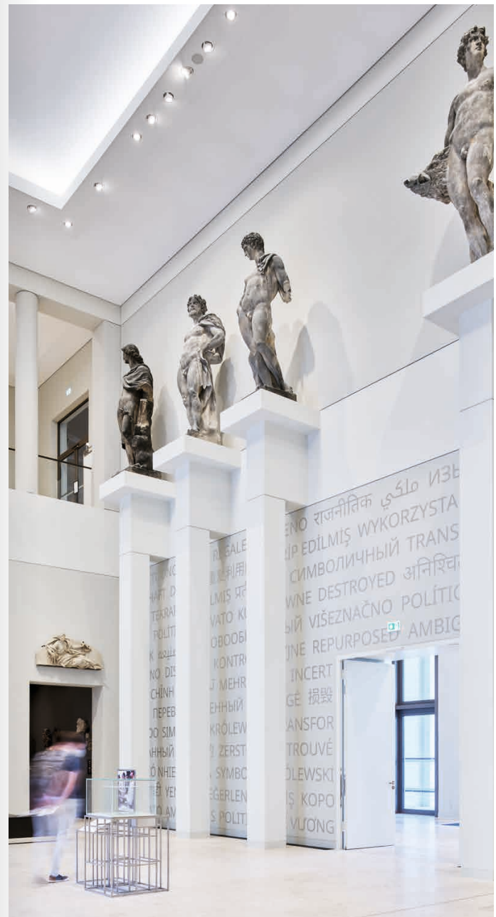
Skulpturensaal mit gläserner Wahlurne

Auf einer Fläche von rund 1000 Quadratmetern bietet die Stiftung Humboldt Forum im Berliner Schloss sechs hochwertig ausgestattete Werk- und Seminarräume sowie Makerspace-Technologien wie 3D-Drucker und Lasercutter. Eine flexibel gestaltbare Aktionsfläche steht für die Arbeit in kleinen Gruppen oder für Präsentationen und den Austausch in größerer Runde zur Verfügung. Zudem finden sich hier eine Auswahl an Literatur zu den zentralen Themen des Humboldt Forums, Spiele, ein Pausenbereich sowie Schließfächer.