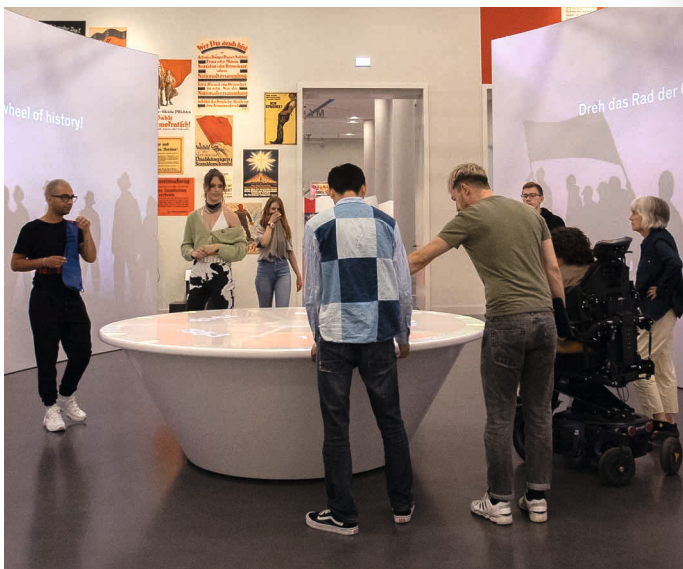
Besucher*innen am Rad der Geschichte in der Ausstellung BERLIN GLOBAL