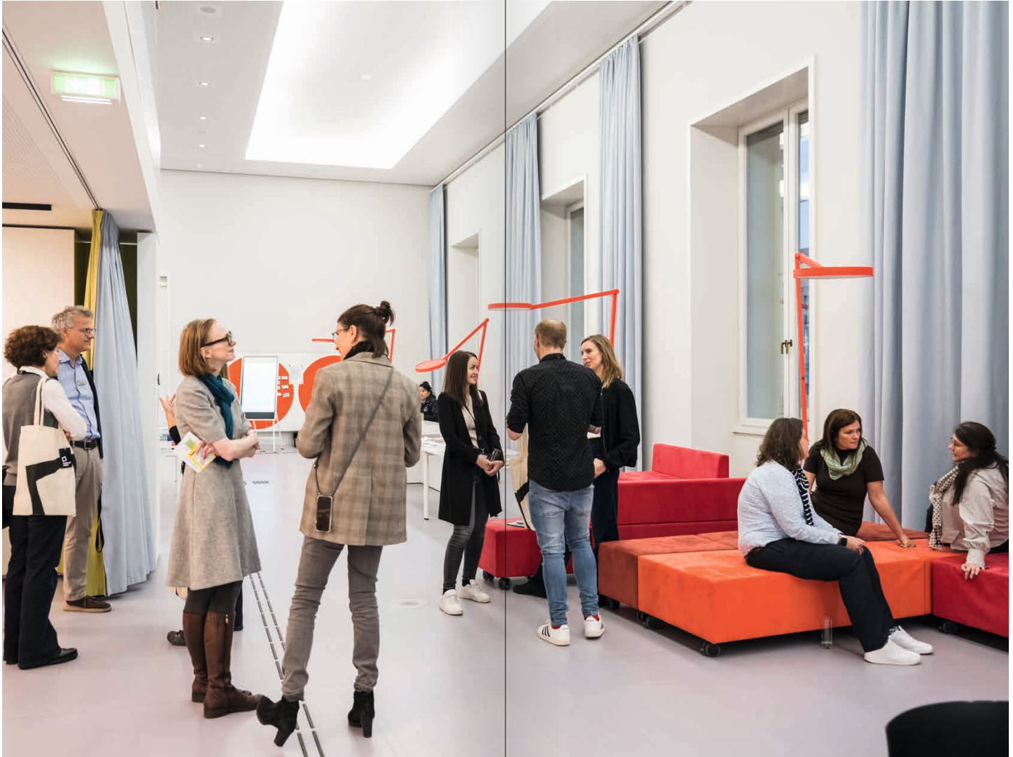
Austausch und Begegnung in den Werkräumen