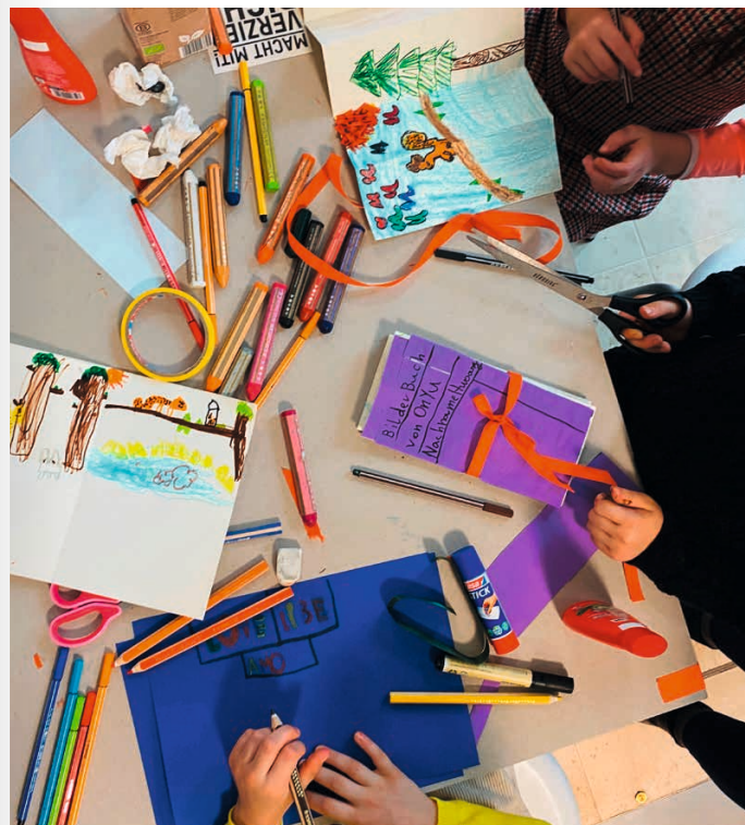
Beim Zeichnen im Workshop Rollbilder, Faltbücher und die Kunst, Geschichten zu erzählen

Um den Stupa, ein traditionelles buddhistisches Bauwerk, befinden sich Reliefs, die Geschichten erzählen. Hinduistische und buddhistische Ausrollbilder, die Patuas und Thangkas, haben eine ähnliche Erzählstruktur. Davon inspiriert gestalten die Kinder eigene farbenfrohe Rollbilder und Leporellos mit ihren erfundenen Geschichten. Sie erfahren auch, dass es viele unterschiedliche Perspektiven auf die Objekte im Museum für Asiatische Kunst gibt und die dargestellten Figuren durchaus heldenhaft und spannend sind.