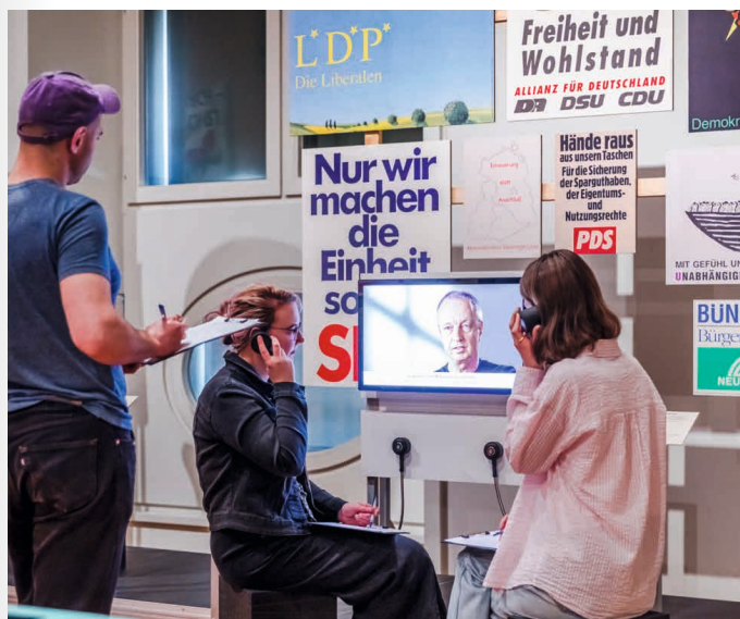
Beim Recherchieren in der Ausstellung Hin und weg . Der Palast der Republik ist Gegenwart

Welche Geschichten und Objekte haben die Kurator*innen für die Präsentation ausgewählt? Welche Bezüge können die Jugendlichen in BERLIN GLOBAL zu ihrer eigenen Lebenswelt herstellen? An drei Projekttagen erkunden sie die Ausstellung und nehmen sie kritisch unter die Lupe. Sie wählen ihre Lieblingsobjekte und -geschichten aus, definieren aber auch Leerstellen. So lernen sie die Arbeit von Kurator*innen kennen. Ausgehend von ihren eigenen Haltungen zur Ausstellung und in Begleitung von Mentor*innen gestalten die Junior-Kurator*innen ein Journal zur Ausstellung mit Fotografien und Rezensionen. Dieses wird zwei Mal produziert – für die Klasse und zur Auslage im WELTSTUDIO.