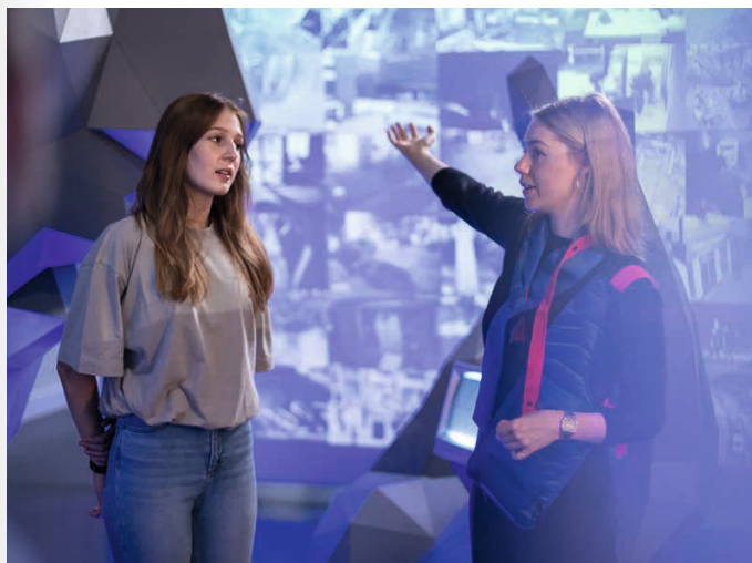
Beim gemeinsamen Rundgang durch die Ausstellung BERLIN GLOBAL

Was ist kolonial an heutiger Fotografie? Welche ökologischen Folgen hat der Kolonialismus? Warum gab es Residential Boarding Schools? Und wie können Kinder und Jugendliche sich diese komplexen Themen im Museum erschließen? Die Fortbildung bietet Einblicke in ausgewählte Ausstellungen, deren Themen und die Ansätze des Vermittlungsprogramms. Gemeinsam werden Methoden und Materialien einer macht-kritischen Vermittlungsarbeit erprobt, die diese Themen für Kinder und Jugendliche erfahrbar machen. Immer im Blick: die Verbindung zur Praxis im Schulunterricht und viele Anregungen zum Mitnehmen!