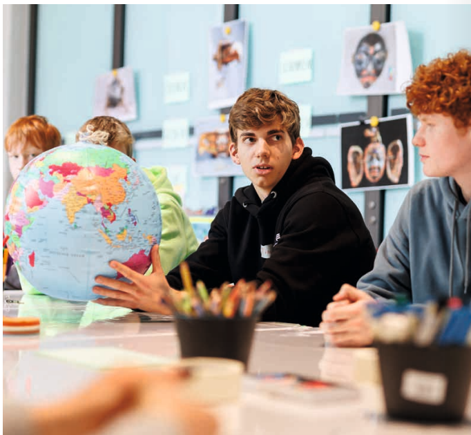
Schüler*innen diskutieren und arbeiten im Workshop Die Welt auf dem Kopf!