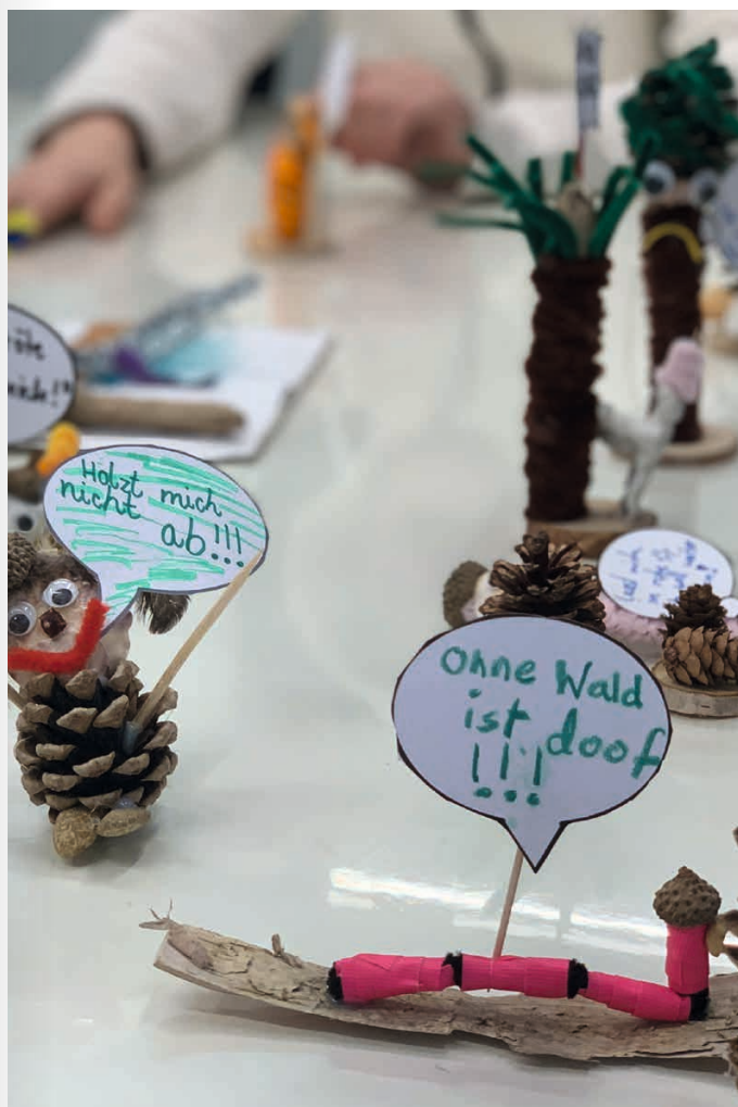
Kreatives Gestalten im Workshop Der Wald protestiert!

Der Wald ist in Gefahr! Überall auf der Welt bedrohen die industrielle Forstwirtschaft und der Klimawandel dieses wichtige Ökosystem. Der Workshop erklärt dies am Beispiel des kanadischen Küstenregenwaldes und zeigt Parallelen zur Flora und Fauna in Deutschland. Wofür brauchen Menschen den Wald? Wie kann eine nachhaltige Waldnutzung aussehen? Und wer profitiert im Wald von wem? Die Kinder geben den nicht (immer) sichtbaren Bewohner*innen der Wälder eine Gestalt und eine Stimme: „Lasst mich stehen!“, ruft die tausendjährige Zeder. „Geh weg mit Deinen Netzen!“, zischt die Welle im Bach.