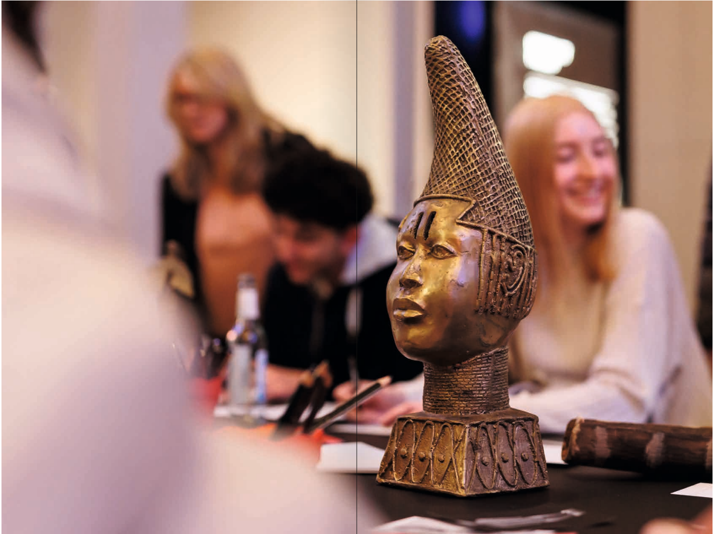
Beim kreativen Austausch vor einer Reproduktion der Büste von Queen Idia im Ethnologischen Museum