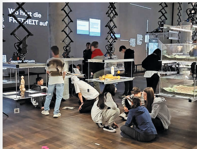
Schüler*innen diskutieren im Humboldt Labor

Der Workshop wird (nach Verfügbarkeit) von Studierenden der Humboldt-Universität zu Berlin durchgeführt.