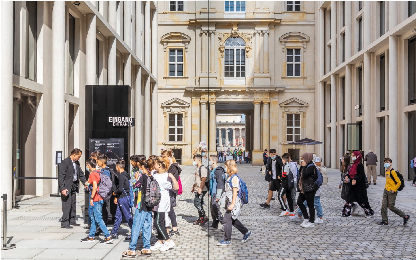
Schulklasse in der Passage des Humboldt Forums