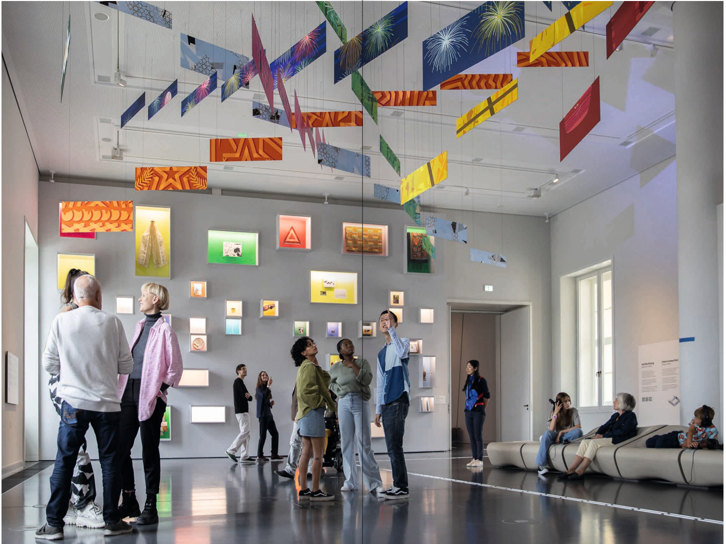
Besucher*innen im Raum Verflechtung in der Ausstellung BERLIN GLOBAL