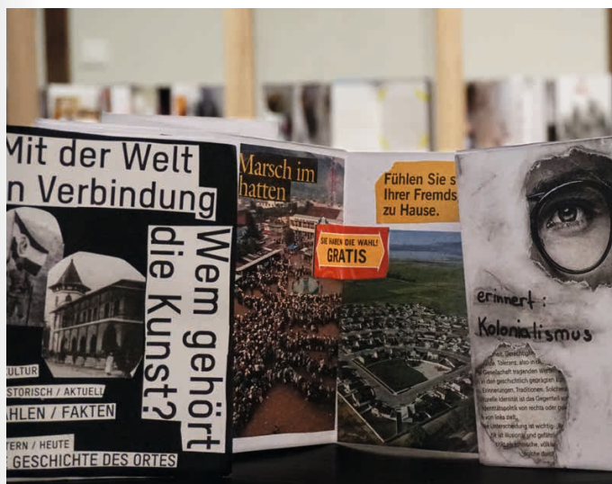
Collagen aus dem Workshop (Welt)Bilder. Koloniale Fotografien lesen

Das Lautarchiv der Humboldt-Universität zu Berlin versammelt einzigartige Sprachaufnahmen von Menschen, die 100 Jahre vor uns gelebt haben. Ab den 1910er Jahren entstand hier unter anderem eine der umfassendsten Sammlungen deutschsprachiger Dialekte. Mal im breitesten Berlinerisch, mal in heute kaum mehr verständlichen lokalen Dialekten, erzählen Menschen aus ihrem Alltag, berichten von Reisen oder Festen, singen Lieder vor. Im Workshop erleben die Schüler*innen, dass sich in diesem Archiv lebendige Geschichten verstecken. Am Beispiel von Kriegsgefangenen, die unfreiwillig bei den Aufnahmen mitwirken mussten, werden die Schüler*innen auch für problematische historische Zusammenhänge von Forschung sensibilisiert. Schließlich ziehen die Teilnehmenden des Workshops selbst los, um im Humboldt Forum Menschen zu befragen und heutige Stimmen aufzunehmen.