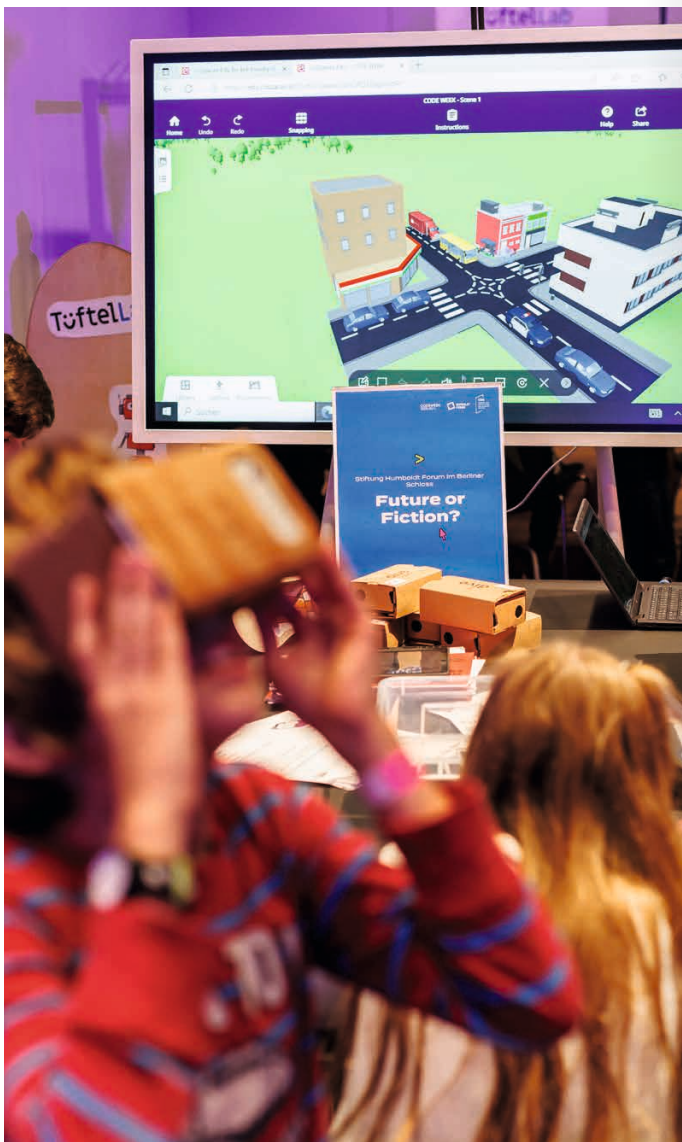
Jugendliche beim Entwerfen virtueller Welten