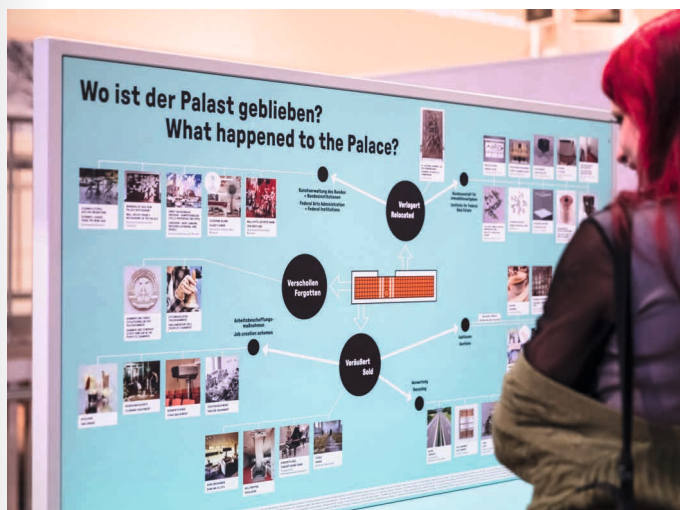
Besucherin in der Ausstellung Hin und weg. Der Palast der Republik ist Gegenwart

Das Humboldt Forum ist ein Neubau, der mit seinen barocken Fassaden an das ehemalige Berliner Schloss erinnert. Forum oder Schloss? Neu oder alt? Diesen Fragen gehen Schüler*innen interaktiv in kleinen Forschungsteams mit einem Forscher*innenbogen, Maßbändern und Ferngläsern nach. Spielerisch nähern sie sich dem Gebäude, seiner Architektur und seinen Schmuckelementen. Den Forscher*innenbogen nehmen die Schüler*innen im Anschluss mit nach Hause.