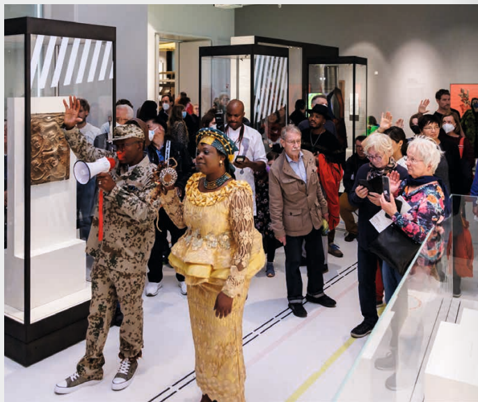
Musikalische Führung It lies in public spaces im Ethnologischen Museum, geplant zur Teachers' Night

Lehrer*innen, Erzieher*innen und alle Interessierten sind eingeladen, die Vielfalt der kulturellen Bildung im Humboldt Forum zu entdecken. Die Teachers' Night bietet Gelegenheit, in Kurzführungen, Performances und Drop-ins die Bildungs- und Vermittlungsangebote für Kinder und Jugendliche kennenzulernen und mit Kolleg*innen ins Gespräch zu kommen.