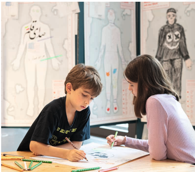
Beim kreativen Austausch im WELTSTUDIO der Ausstellung BERLIN GLOBAL