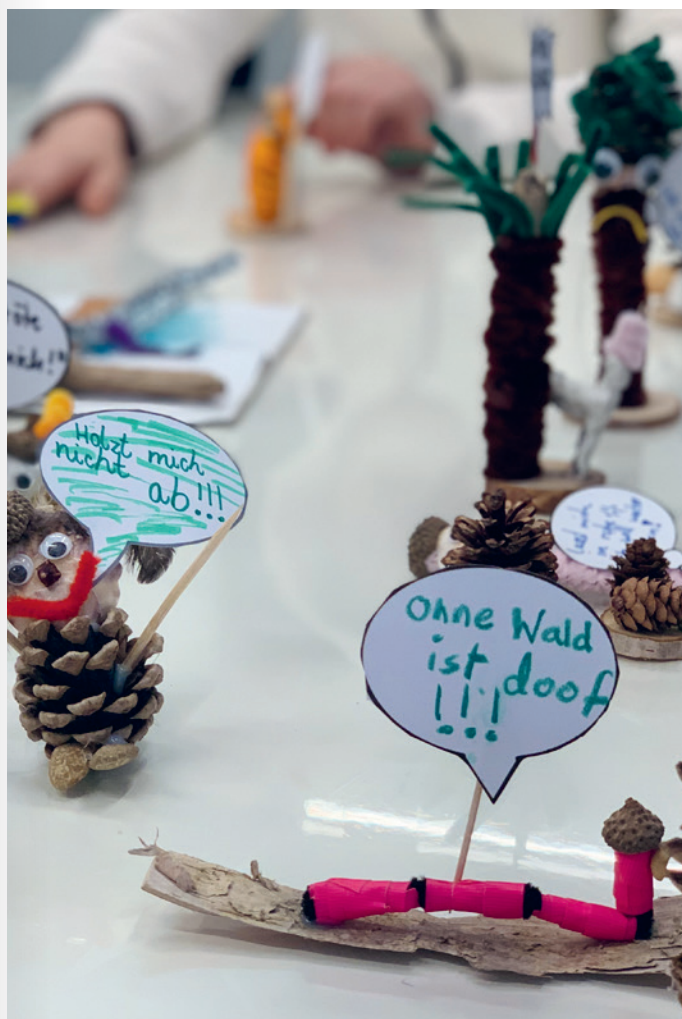
Kreatives Gestalten im Workshop Der Wald protestiert!

Der Wald ist in Gefahr! Überall auf der Welt bedrohen die industrielle Forstwirtschaft und der Klimawandel dieses wichtige Ökosystem. Der Workshop erklärt dies am Beispiel des kanadischen Küstenregenwaldes und zeigt Parallelen zur Flora und Fauna in Deutschland. Wofür brauchen Menschen den Wald? Wie kann eine nachhaltige Waldnutzung aussehen? Und wer profitiert im Wald von wem? Die Kinder geben den nicht (immer) sichtbaren Bewohner*innen der Wälder eine Gestalt und eine Stimme: „Lasst mich stehen!“, ruft die tausendjährige Zeder. „Geh weg mit Deinen Netzen!“, zischt die Welle im Bach.