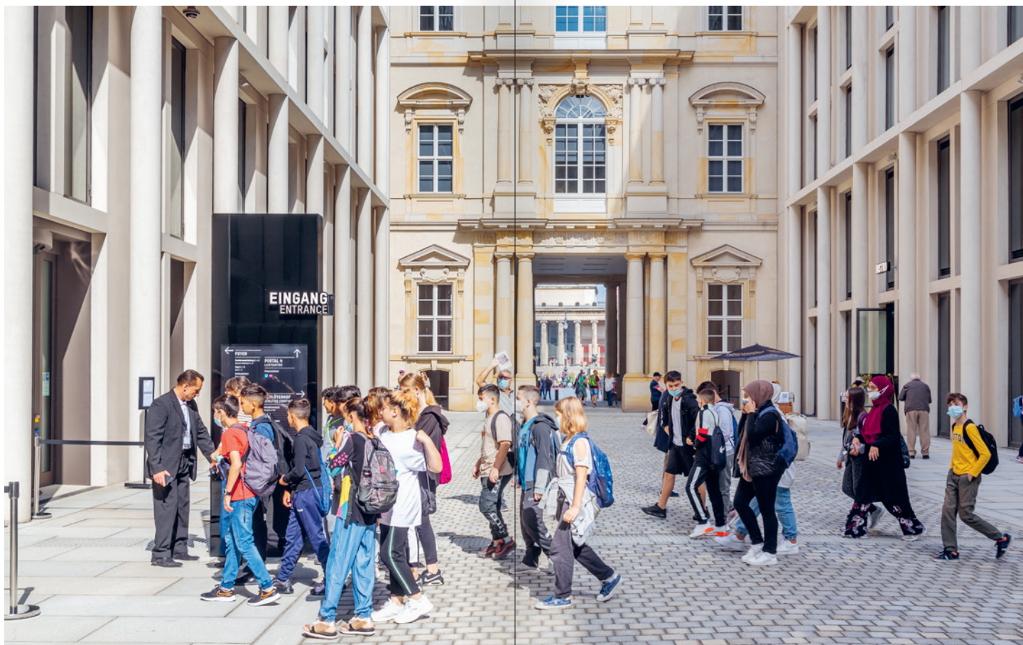
Schulklasse in der Passage des Humboldt Forums