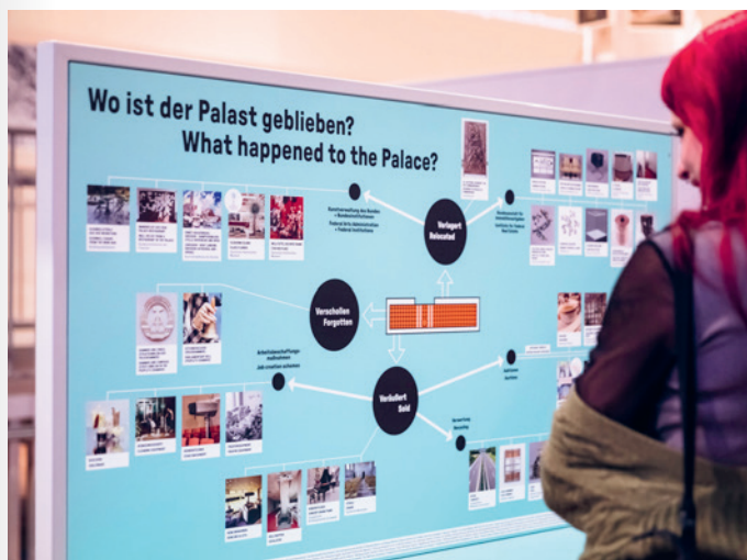
Besucherin in der Ausstellung Hin und weg. Der Palast der Republik ist Gegenwart

Das Humboldt Forum ist ein Neubau, der mit seinen barocken Fassaden an das ehemalige Berliner Schloss erinnert. Forum oder Schloss? Neu oder alt? Diesen Fragen gehen Schüler*innen interaktiv in kleinen Forschungsteams mit einem Forscher*innenbogen, Maßbändern und Ferngläsern nach. Spielerisch nähern sie sich dem Gebäude, seiner Architektur und seinen Schmuckelementen. Den Forscher*innenbogen nehmen die Schüler*innen im Anschluss mit nach Hause.