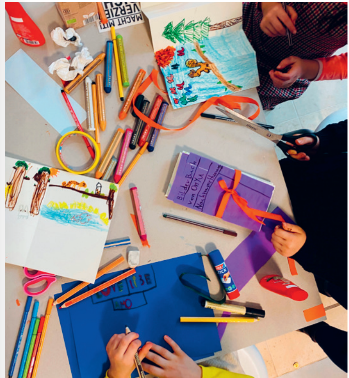
Beim Zeichnen im Workshop Rollbilder, Faltbücher und die Kunst, Geschichten zu erzählen

Um den Stupa, ein traditionelles buddhistisches Bauwerk, befinden sich Reliefs, die Geschichten erzählen. Hinduistische und buddhistische Ausrollbilder, die Patuas und Thangkas, haben eine ähnliche Erzählstruktur. Davon inspiriert gestalten die Kinder eigene farbenfrohe Rollbilder und Leporellos mit ihren erfundenen Geschichten. Sie erfahren auch, dass es viele unterschiedliche Perspektiven auf die Objekte im Museum für Asiatische Kunst gibt und die dargestellten Figuren durchaus heldenhaft und spannend sind.