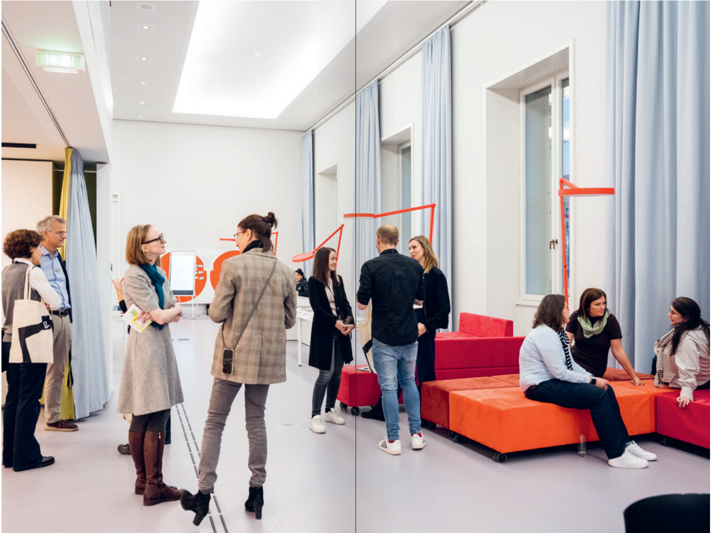
Austausch und Begegnung in den Werkräumen