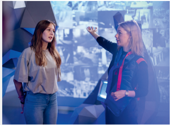
Beim gemeinsamen Rundgang durch die Ausstellung BERLIN GLOBAL

Was ist kolonial an heutiger Fotografie? Welche ökologischen Folgen hat der Kolonialismus? Warum gab es Residential Boarding Schools? Und wie können Kinder und Jugendliche sich diese komplexen Themen im Museum erschließen? Die Fortbildung bietet Einblicke in ausgewählte Ausstellungen, deren Themen und die Ansätze des Vermittlungsprogramms. Gemeinsam werden Methoden und Materialien einer macht-kritischen Vermittlungsarbeit erprobt, die diese Themen für Kinder und Jugendliche erfahrbar machen. Immer im Blick: die Verbindung zur Praxis im Schulunterricht und viele Anregungen zum Mitnehmen!