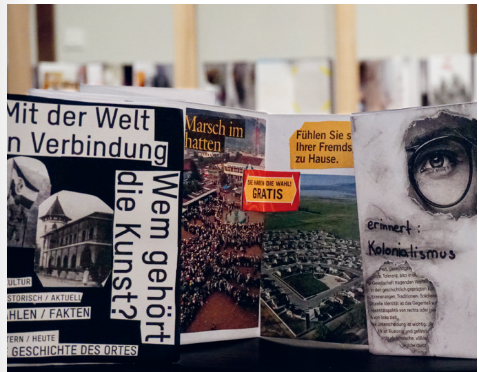
Collagen aus dem Workshop (Welt)Bilder. Koloniale Fotografien lesen

Das Lautarchiv der Humboldt-Universität zu Berlin versammelt einzigartige Sprachaufnahmen von Menschen, die 100 Jahre vor uns gelebt haben. Ab den 1910er Jahren entstand hier unter anderem eine der umfassendsten Sammlungen deutschsprachiger Dialekte. Mal im breitesten Berlinerisch, mal in heute kaum mehr verständlichen lokalen Dialekten, erzählen Menschen aus ihrem Alltag, berichten von Reisen oder Festen, singen Lieder vor. Im Workshop erleben die Schüler*innen, dass sich in diesem Archiv lebendige Geschichten verstecken. Am Beispiel von Kriegsgefangenen, die unfreiwillig bei den Aufnahmen mitwirken mussten, werden die Schüler*innen auch für problematische historische Zusammenhänge von Forschung sensibilisiert. Schließlich ziehen die Teilnehmenden des Workshops selbst los, um im Humboldt Forum Menschen zu befragen und heutige Stimmen aufzunehmen.