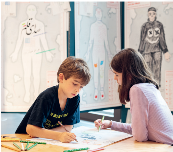
Beim kreativen Austausch im WELTSTUDIO der Ausstellung BERLIN GLOBAL