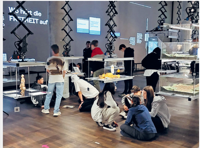
Schüler*innen diskutieren im Humboldt Labor

Der Workshop wird (nach Verfügbarkeit) von Studierenden der Humboldt-Universität zu Berlin durchgeführt.