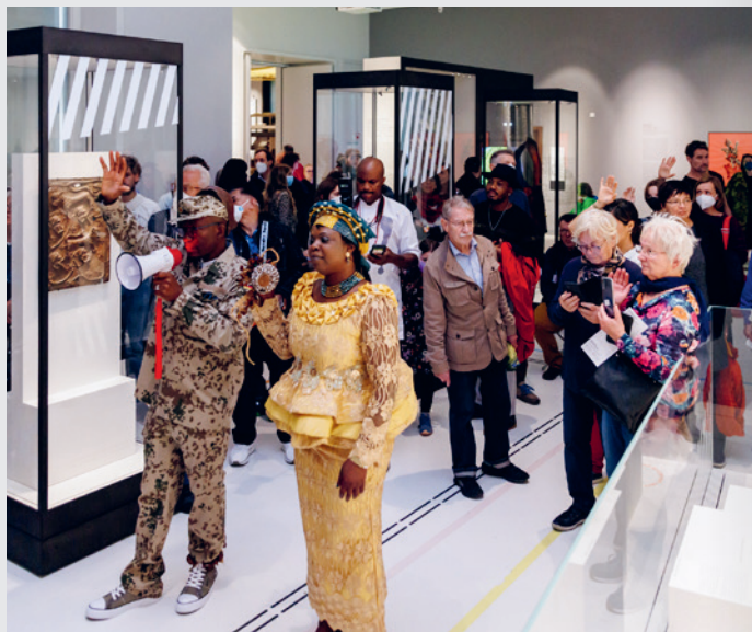
Musikalische Führung It lies in public spaces im Ethnologischen Museum, geplant zur Teachers' Night

Lehrer*innen, Erzieher*innen und alle Interessierten sind eingeladen, die Vielfalt der kulturellen Bildung im Humboldt Forum zu entdecken. Die Teachers' Night bietet Gelegenheit, in Kurzführungen, Performances und Drop-ins die Bildungs- und Vermittlungsangebote für Kinder und Jugendliche kennenzulernen und mit Kolleg*innen ins Gespräch zu kommen.