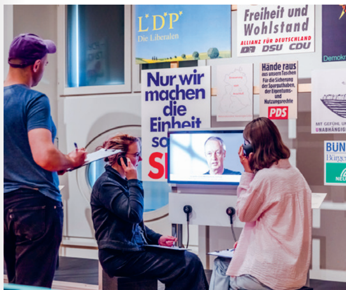
Beim Recherchieren in der Ausstellung Hin und weg . Der Palast der Republik ist Gegenwart

Welche Geschichten und Objekte haben die Kurator*innen für die Präsentation ausgewählt? Welche Bezüge können die Jugendlichen in BERLIN GLOBAL zu ihrer eigenen Lebenswelt herstellen? An drei Projekttagen erkunden sie die Ausstellung und nehmen sie kritisch unter die Lupe. Sie wählen ihre Lieblingsobjekte und -geschichten aus, definieren aber auch Leerstellen. So lernen sie die Arbeit von Kurator*innen kennen. Ausgehend von ihren eigenen Haltungen zur Ausstellung und in Begleitung von Mentor*innen gestalten die Junior-Kurator*innen ein Journal zur Ausstellung mit Fotografien und Rezensionen. Dieses wird zwei Mal produziert – für die Klasse und zur Auslage im WELTSTUDIO.