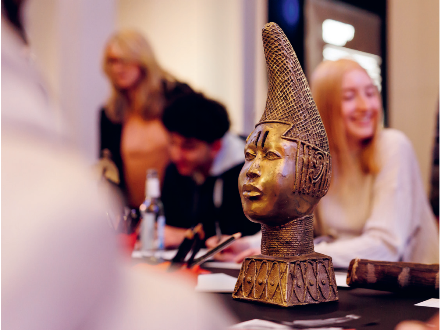
Beim kreativen Austausch vor einer Reproduktion der Büste von Queen Idia im Ethnologischen Museum