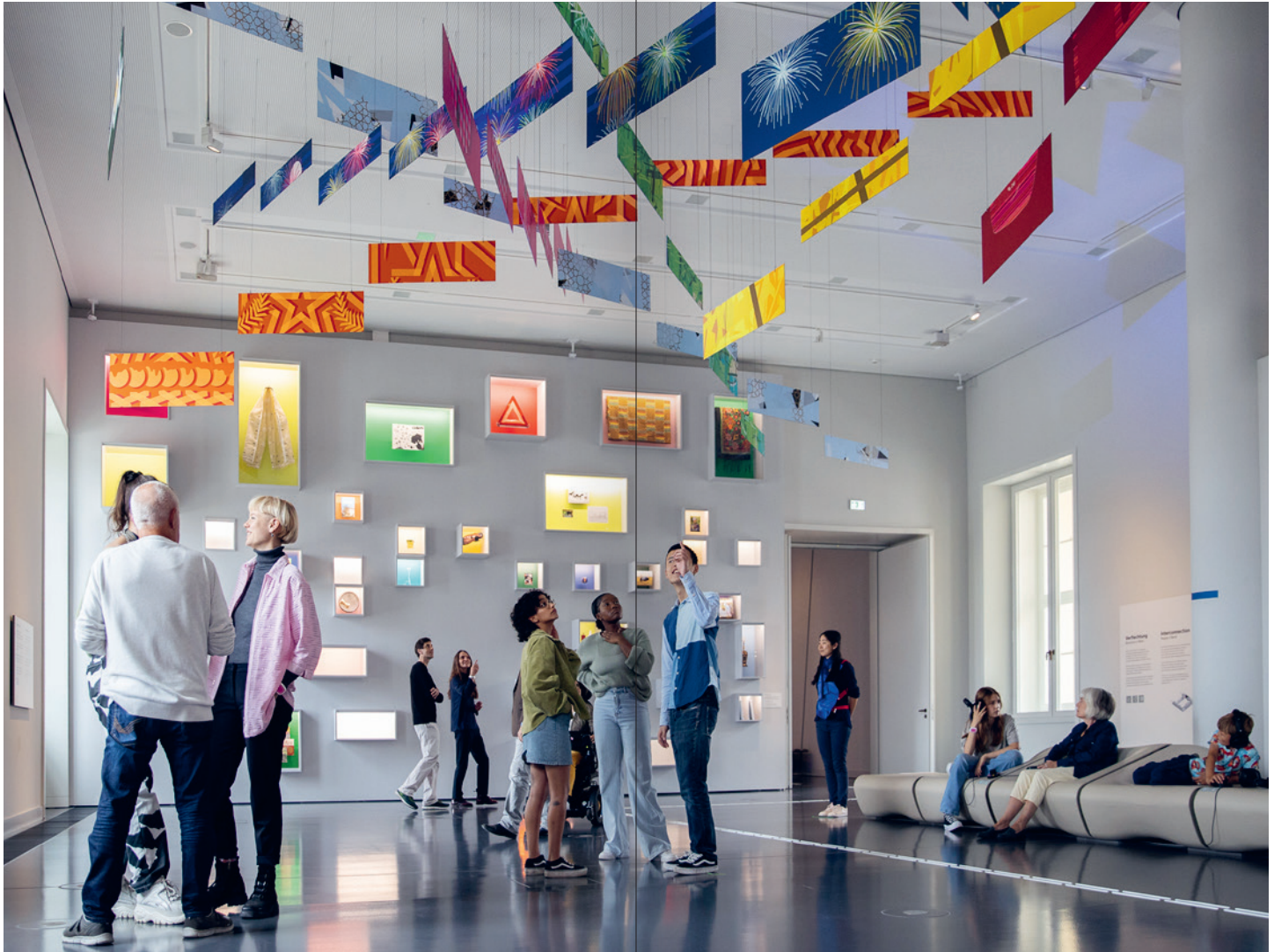
Besucher*innen im Raum Verflechtung in der Ausstellung BERLIN GLOBAL