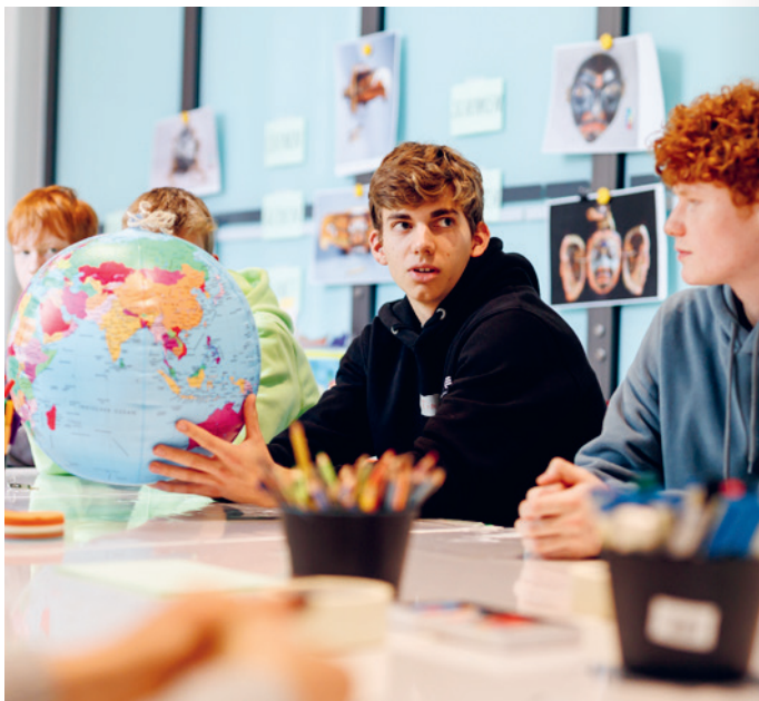
Schüler*innen diskutieren und arbeiten im Workshop Die Welt auf dem Kopf!