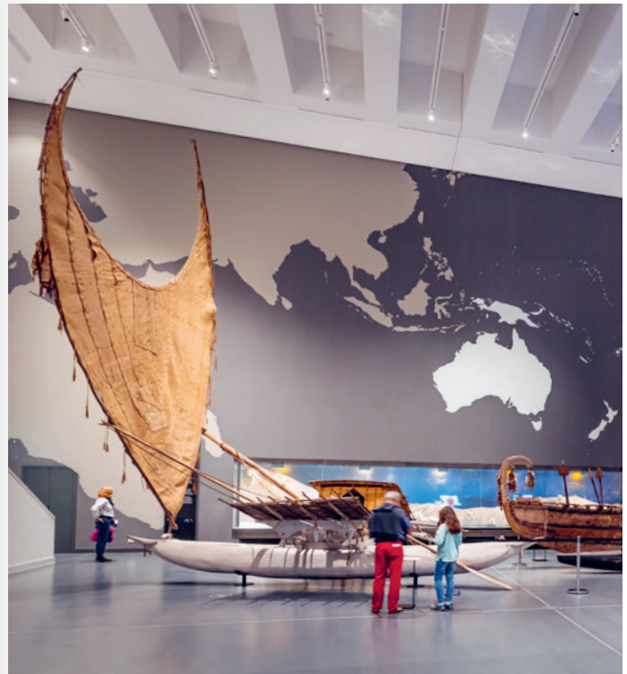
Besucher*innen im Boote-Kubus des Ethnologischen Museums

Der Hinduismus lebt von einer Vielzahl religiöser Traditionen, Gött*innen und deren Mythen. Anhand von Skulpturen des Museums für Asiatische Kunst lernen die Schüler*innen die Vielfalt der Gottheiten kennen: Shiva als Gott der Schöpfung und Zerstörung, die vollkommene Göttin Durga und den elefantenköpfigen Ganesha. Sie treffen auf den Stier Nandi und den lebenswürdigen Krishna, einen Avatar des Gottes Vishnu.