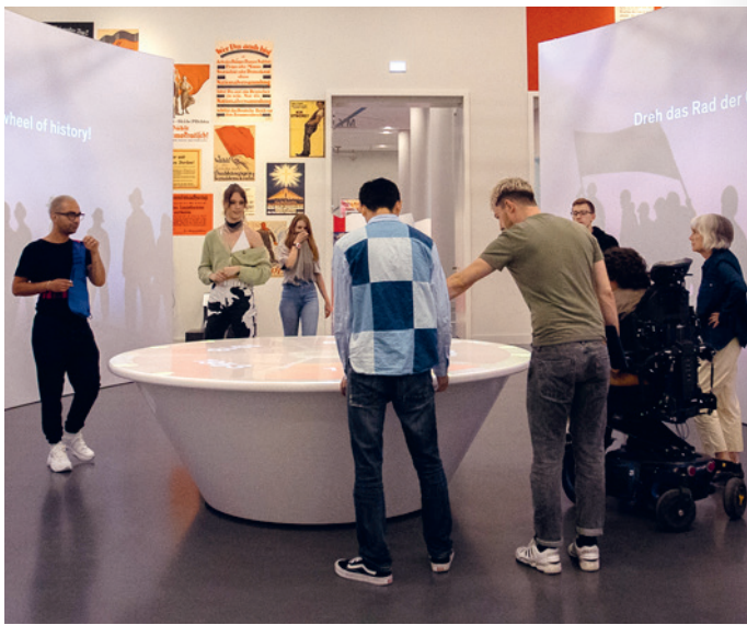
Besucher*innen am Rad der Geschichte in der Ausstellung BERLIN GLOBAL