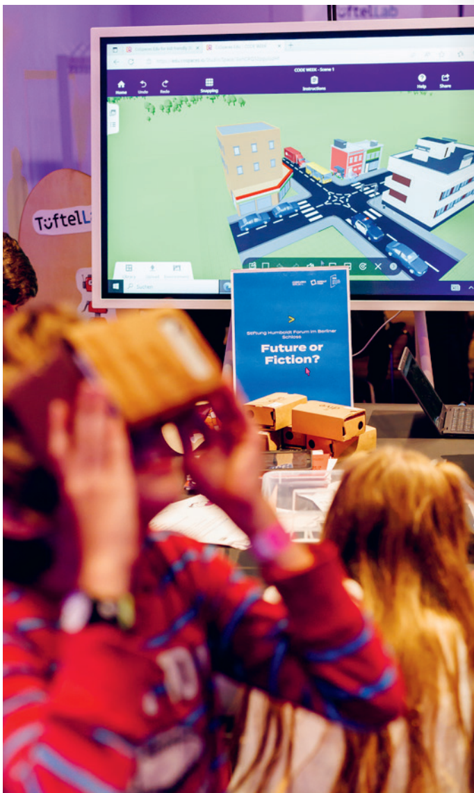
Jugendliche beim Entwerfen virtueller Welten