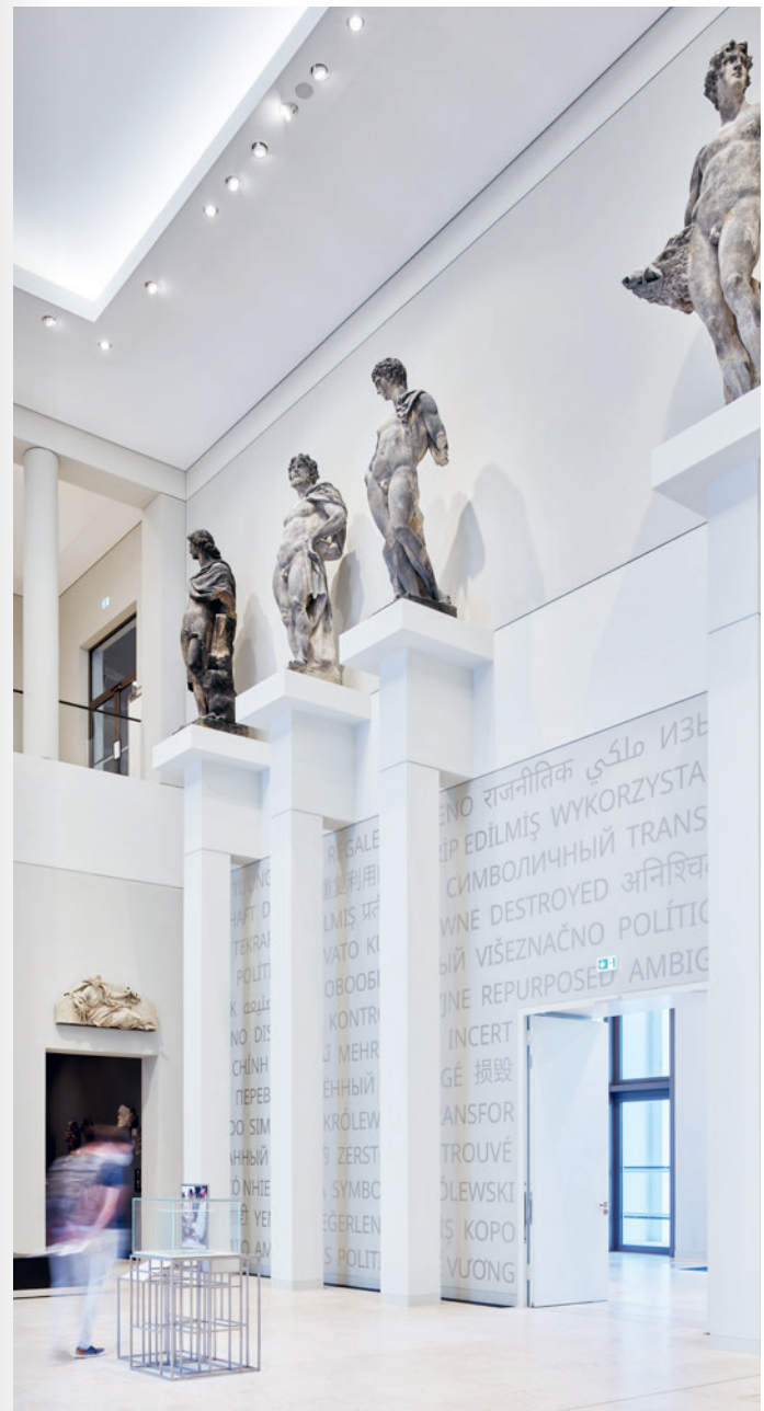
Skulpturensaal mit gläserner Wahlurne

Auf einer Fläche von rund 1000 Quadratmetern bietet die Stiftung Humboldt Forum im Berliner Schloss sechs hochwertig ausgestattete Werk- und Seminarräume sowie Makerspace-Technologien wie 3D-Drucker und Lasercutter. Eine flexibel gestaltbare Aktionsfläche steht für die Arbeit in kleinen Gruppen oder für Präsentationen und den Austausch in größerer Runde zur Verfügung. Zudem finden sich hier eine Auswahl an Literatur zu den zentralen Themen des Humboldt Forums, Spiele, ein Pausenbereich sowie Schließfächer.